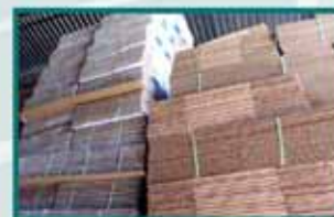
Armazenagem e pronta entrega

Caixas de Papelão ondulado e micro ondulado.