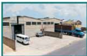
3 Galpões estruturados

A embalagem não é apenas um mero detalhe.