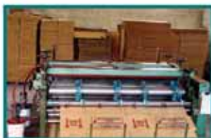
Maquinário mais eficiente