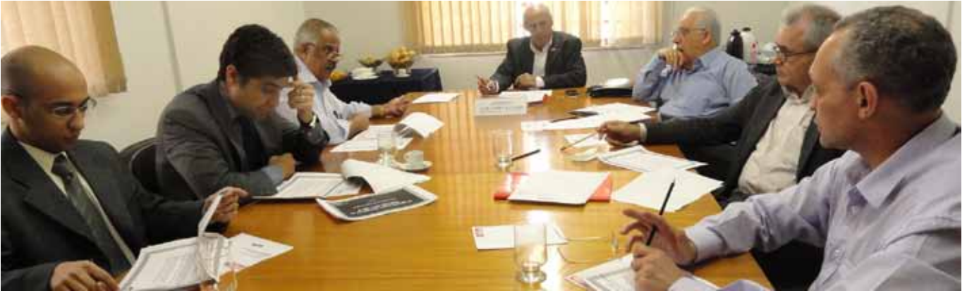
Reunião da CIBF discutiu propostas para o desenvolvimento e sustentabilidade das empresas mineiras