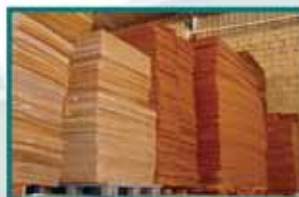
Maior estoque, mais agilidade